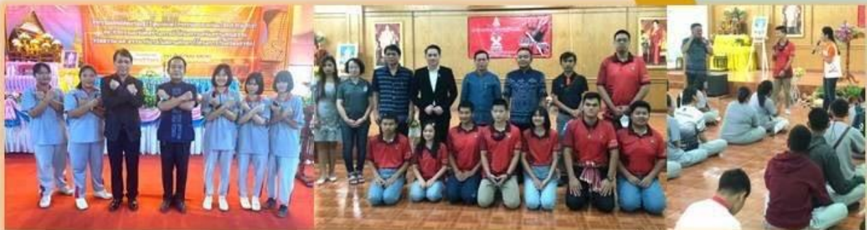
โรงเรียนบ้านเชียงวิทยา เข้าร่วมอบรมตามโครงการ “เด็กอุดรสัญจรด้านทุจริต ครั้งที่ 2” โดยสภาเด็กและเยาวชนจังหวัดอุดรธานี ณ โรงเรียนบ้านเชียงวิทยา