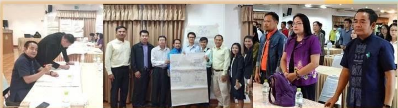
โรงเรียนบ้านเชียงวิทยา เข้าร่วมประชุมรับนโยบายการดำเนินการป้องกันและแก้ไขปัญหาเสพติดในสถานศึกษา วันที่ 23 กันยายน 2563 ณ หอประชุมพุทธรักษา สำนักเขตพื้นที่การศึกษามัธยมศึกษาเขต 20